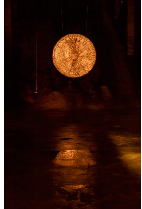
Jeppe Hein: In Is the Only Way Out , installationsview, Cisternerne, 2018.

Installationen i udstillingens bageste rum aktiveres også af de besøgende. I en bane, der snor sig oppe under loftet, turnerer små vogne, som hver især transporterer en kugle i en snor. På denne rundtur passerer kuglerne en halv snes messingskåle – såkaldte syngeskåle, der afgiver en klang i forhold til, hvor hårdt og hurtigt kuglen rammer den. Hver gang en person træder ind i rummet, sendes en vogn med bold afsted påny, og det medfører alt efter besøgstallet et virvar af lyd, svingende objekter og folk, der prøver at orientere sig i værket.