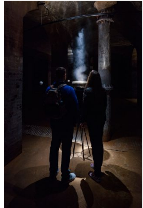
Jeppe Hein: In Is the Only Way Out, installationsview, Cisternerne, 2018.

Som kunstner får man meget foræret af et udstillingssted som Cisternerne, der tager sig ud som en urban drypstenshule med masser af blinde vinkler, der ansporer en både dyster og højtidelig stemning. Det er et rum, kunstneren skal være i stand til at aktivere for ikke at drukne i, og det er derfor ikke underligt, at stedet tiltrækker nogle af landets største navne til udstillinger, der varer en hel sæson. Således er den internationalt anerkendte Jeppe Hein (f. 1974) et logisk valg i den tradition, og han tilbyder os med turen ned i dybet en tilsvarende rejse ind i os selv.