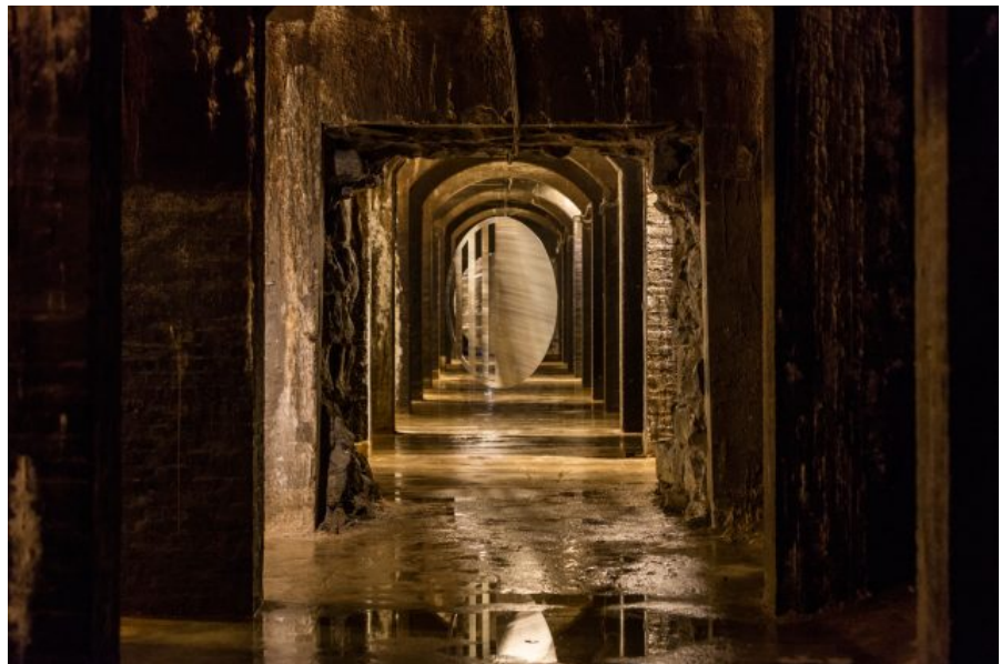
Jeppe Hein: In Is the Only Way Out , installationsview, Cisternerne, 2018.

I Cisternerne andet rum hænger ikke færre end femten kropsstore uroer i form af dobbeltsidede spejle. De umiddelbart ensartede værker har hver deres geometriske egenart, men arbejder alle med en forskydning af det spejlede, hvad enten det er gennem perforering, vinkling eller blot rotation. Det er velkendt minimalisme fra Heins side, og formmæssigt er de spejle, der arbejder med udtrykket fra banket metal, de mest interessante, især fordi vi allerede blev introduceret til formen i det første rum og støder på den igen senere.