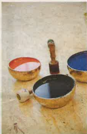
Färg i buddhistiska meditationsskålar. Ingår i en av stationerna på konsthallen.