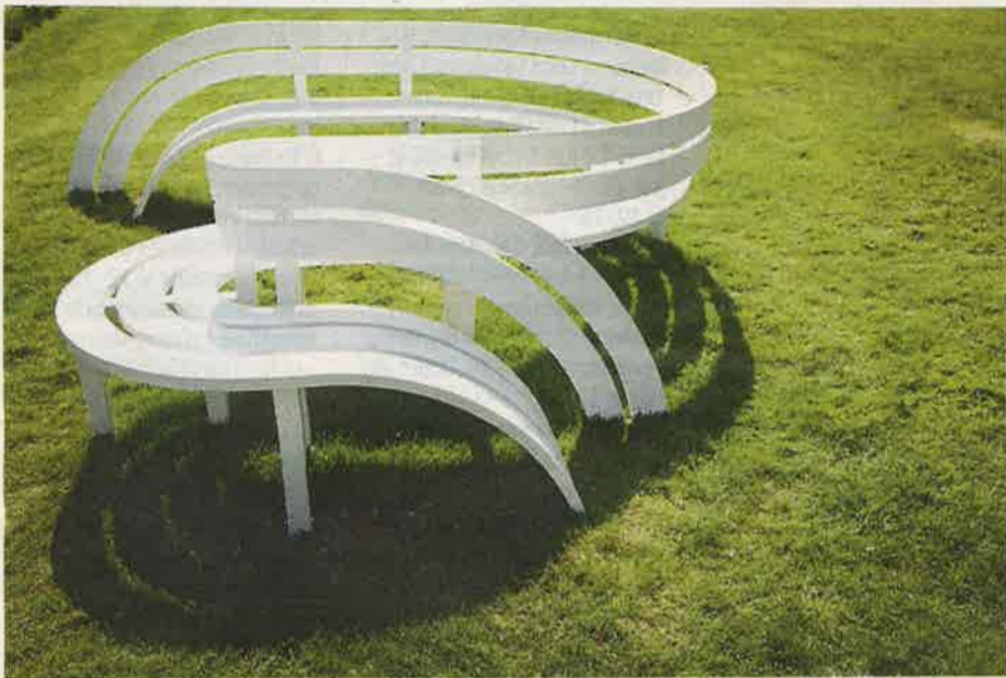
Runt dammen på Wanås har Jeppe Hein placerat sju vita bänkar, som genom sina överraskande och mjuka former uppmuntrar till social kontakt, oavsett om man vill eller inte.